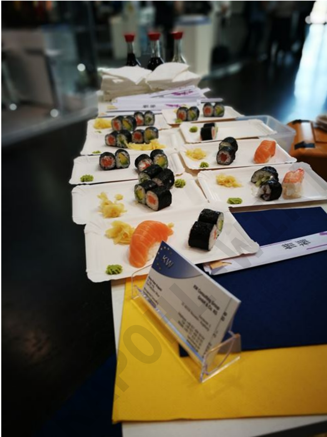
Allseits beliebt war unser Sushi und ...